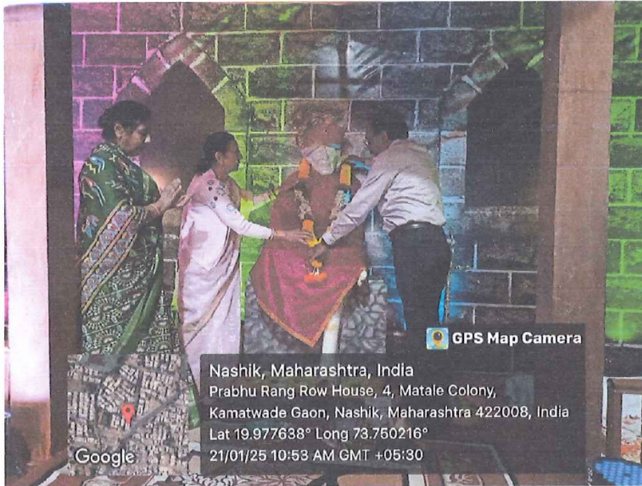
RESPECTED CHAIRMAN MAM AND PRINCIPAL SIR WITH OUR STUDENTS